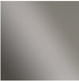
Black nichel Black nickel